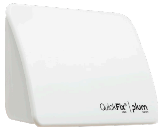
Plum QuickFix Uno, blanc