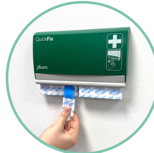
Retirer le pansement