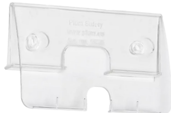
Plum QuickFix Solo®, transparent