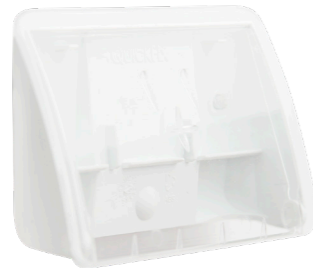
Plum QuickFix Uno, transparent