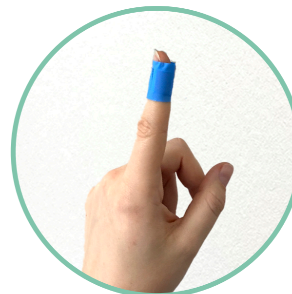
Et retour au travail