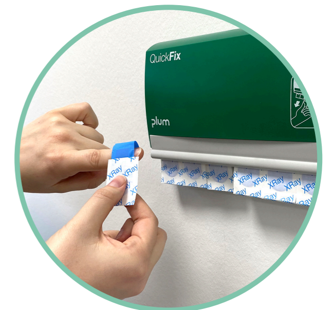
Enfilez-le d'une seule main